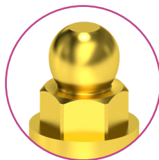
Slim BG gömbfejes csatlakozás